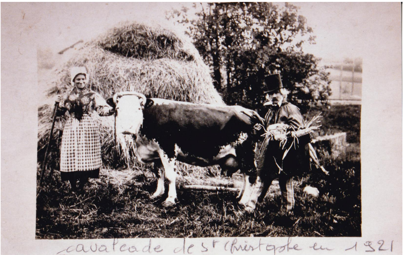
Cette autre photo datée m'avait été confiée par Marguerite Verrier.