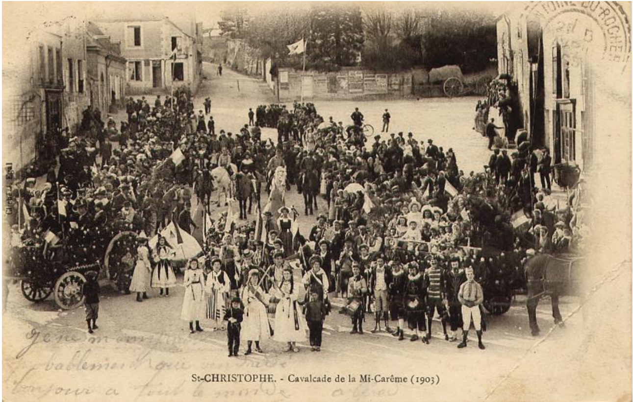
St-CHRISTOPHE. - Cavalcade de la Mi-Carême (1903)

Au début du XX e siècle, nous pouvions bien parler de cavalcades car les participants utilisaient, pour certains, des chevaux, comme sur la carte postale suivante.