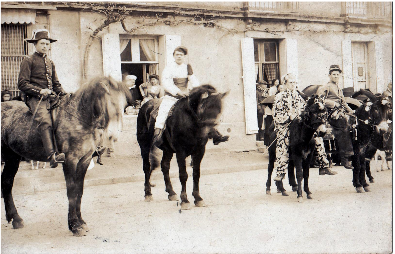
Ces photos ont été prises devant la boucherie, sur la place Jehan d'Alluye actuelle, mais à une date inconnue.