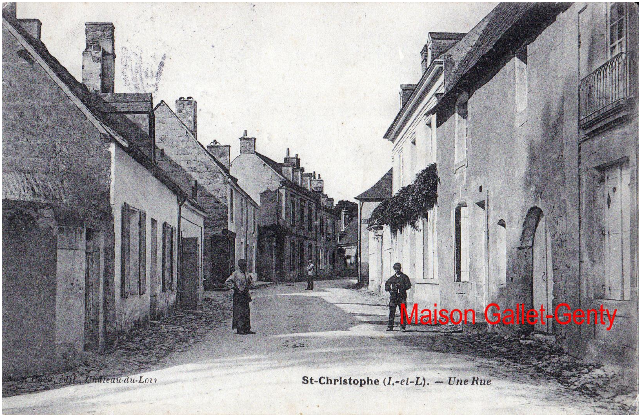
La demeure des Gallet-Genty, en bas de la rue des Tanneurs.